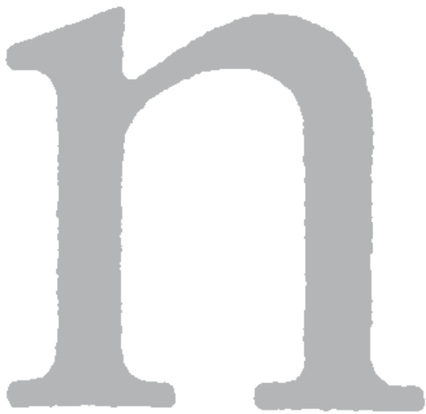
original drawings by Josef Týfa